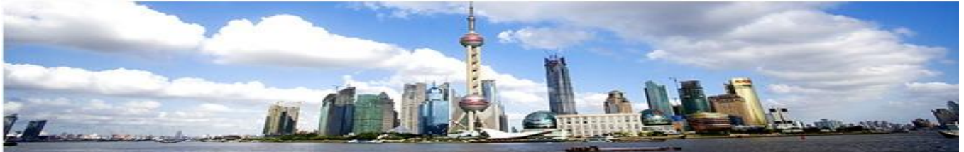
上海外灘東方明珠美景